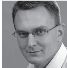
Dr. Rétvári Bence

Dr. Hoffmann Rózsa köznevelésért felelős államtitkár beszámolójában hangsúlyozta, hogy az oktatásnak a nagy nehézségek ellenére is meg kell újulnia. A megújulás céljaként tűzték ki a gyermekek fejlődését, a családok jól-létét, a nevelés megerősítését, az oktatás színvonalának emelését. Az államtitkárásszony említett a hároméves kortól kötelező óvodai oktatásról, a mindennapos testnevelésről, a középiskolákban bevezetett közösségi szolgálatról. Az erkölcs tan bevezetéséről nagyon jó visszajelzéseket kapott dr. Hoffmann Rózsa. Húsz perccel át sorolta az eddig bevezetésre került célokat. „Valódi esély mindenkinek” – így hangzott a bevezető. „Civilizált, erkölcsös nemzedéket szeretnénk” – volt a végző.